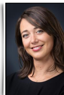
Expertise Développement Durable

POUR NOUS JOINDRE : + 33 (0)1 47 32 81 30 - FOOD@UNIPEX.COM