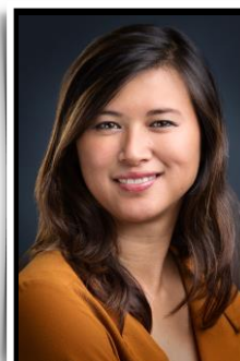
Expertise Qualité & Réglementaire