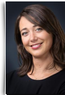
Expertise Développement Durable

POUR NOUS JOINDRE : + 33 (0)1 47 32 81 30 – NUTRA@UNIPEX.COM