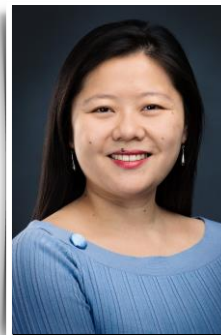
Expertise Qualité & Réglementaire