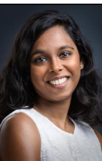
Expertise Qualité & Réglementaire