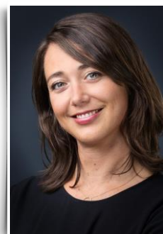
Expertise Développement Durable

POUR NOUS JOINDRE : + 33 (0)1 47 32 81 30 – PHARMA@UNIPEX.COM