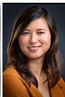
Expertise Qualité & Réglementaire