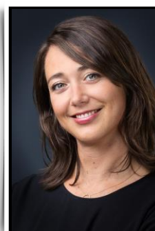
Expertise Développement Durable

POUR NOUS JOINDRE : + 33 (0)1 47 08 30 60 – CHEMICAL@UNIPEX.COM